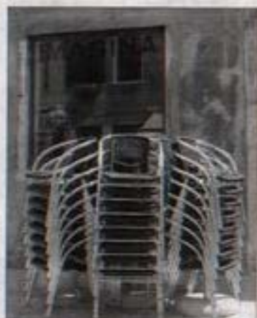
Fotografía titulada 'El monumento como monumento'

Chocolata, pólvora, dinamita, cera de velas, lán. Todos estos materiales pueden traducirse en arte si se contemplan las obras de César Martínez. Este artista mexicano, afincado en España, muestra estos días una selección de sus obras que se caracterizan, no sólo por la utilización de materiales diversos, sino por su espíritu creativo, su curiosidad y un sentido del humor. Todo ello queda reflejado en una exposición titulada Aproximaciones a la distancia (tema II) que puede verse en la Sala Carlos III (Avenida Carlos III) de la UPNA.