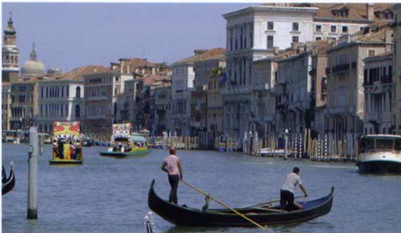
César Martínez, Venecia (2005). Lantex print, 60x80 cm Edición de / edition by Arte y Naturaleza

as legitimate evidence (but which we know is pure counterfeit construction) provoke a threat against transparency that the western Cartesian model has established between the true and the false, between the real and the imaginary. The photos conceal and pervert, as the French philosopher would say, a grounded reality. They play at disguising their real absence. It's through this recourse to falsification that the photographic constructions offered here serve to establish a symbolic exchange able to shake up habitual schemes of presenting the reality of 'the other,' at the same time as indu-