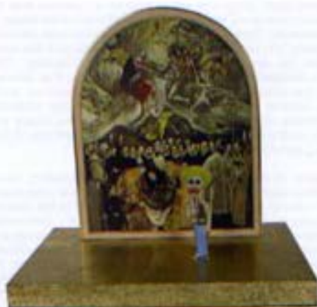
César Martínez, El Greco Phasala, (2006)