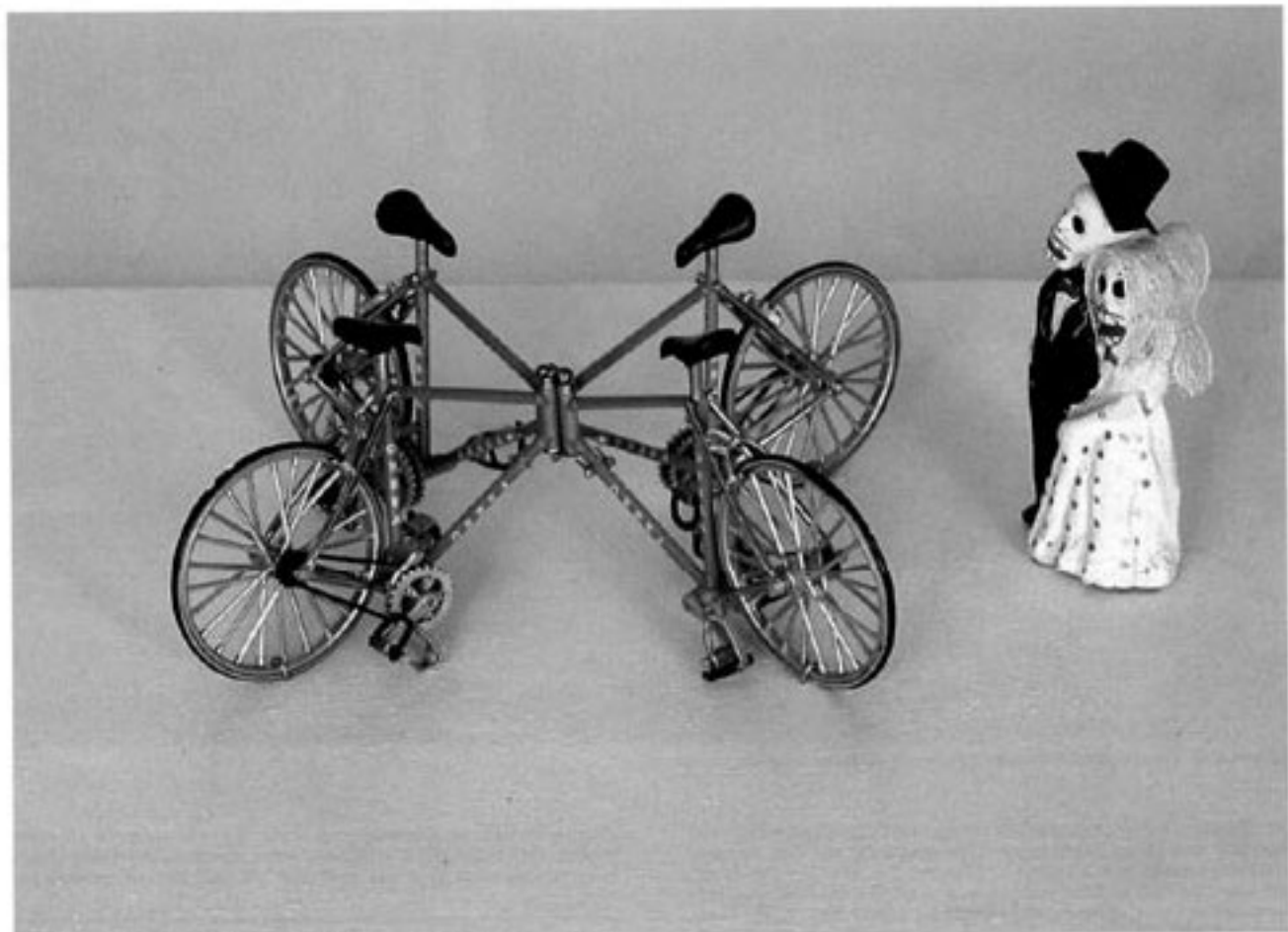
César Martínez, Ninguna parte / Nowhere , (2006). Técnica mixta / mixed media, 29x34x10 cm

judgments and fixed categories when applied to realities that operate with temporal-cultural logical schemes different than those of a European character. Taking as a starting point the phrase uttered by Baron Alejandro Von Humboldt; when, trying to describe the beauty of Xochimilco, he described it as "the American Venice," César undertakes a meditation in the domain of aesthetics that insists on denouncing the complex relations woven through culture, politics and history, exactly as they are glimpsed from the horizon of European modes of approach, and the crisis of the major paradigms which, until a few decades ago, guided the critique of culture within the Latin American sphere.